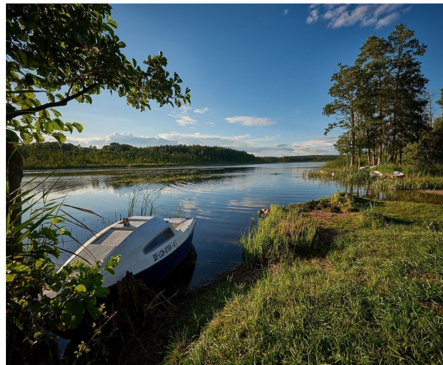
Jezioro Stolsko - Stolec

DO ZOBACZENIA NA TRASIE I MECIE RAJDU. ORGANIZATORZY